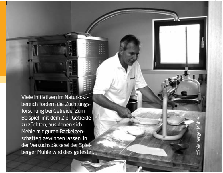
Viele Initiativen im Naturkostbereich fördern die Züchtungsforschung bei Getreide. Zum Beispiel mit dem Ziel, Getreide zu züchten, aus denen sich Mehle mit guten Backeigenschaften gewinnen lassen. In der Versuchsbäckerei der Spielberger Mühle wird dies getestet.

Beutelsbacher und Voelkel haben Spezialitäten im Angebot, die zu 100 Prozent aus samenfesten Gemüsesorten gewonnen werden. Damit leisten sie einen wichtigen Beitrag zum Erhalt und zur Verbreitung samenfester Sorten.